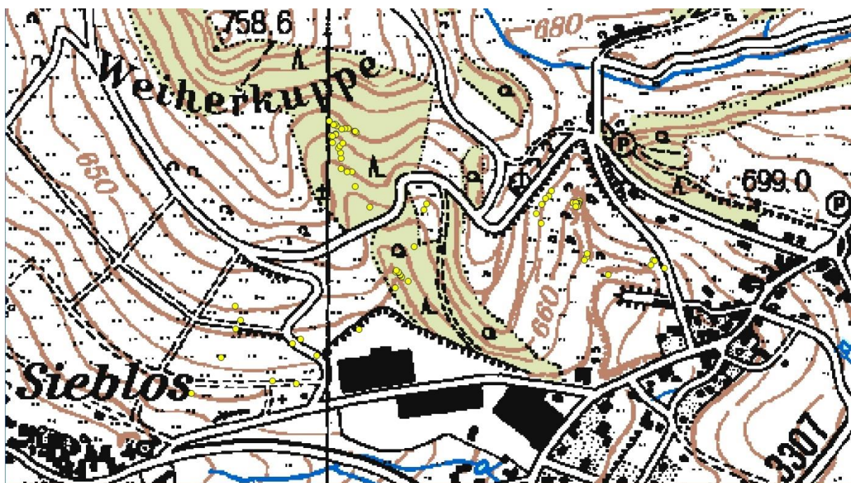
Abb.: Lage der Quellen am Südhang und Südosthang der Weiherkuppe

Am Südhang und Südosthang der Weiherkuppe bis in den Bereich westlich von Abtsroda wurden insgesamt 71 Quellen untersucht. Ein Teil dieser Quellbereiche liegt auf landwirtschaftlich genutzten Flächen und ist oft durch Eutrophierung, Viehvertritt oder Fahrspuren landwirtschaftlicher Fahrzeuge beeinträchtigt. Hier könnten einige Standorte durch eine Reduzierung der Düngung, eine extensive Beweidung und das Auszäunen der unmittelbaren Quellbereiche verbessert werden.