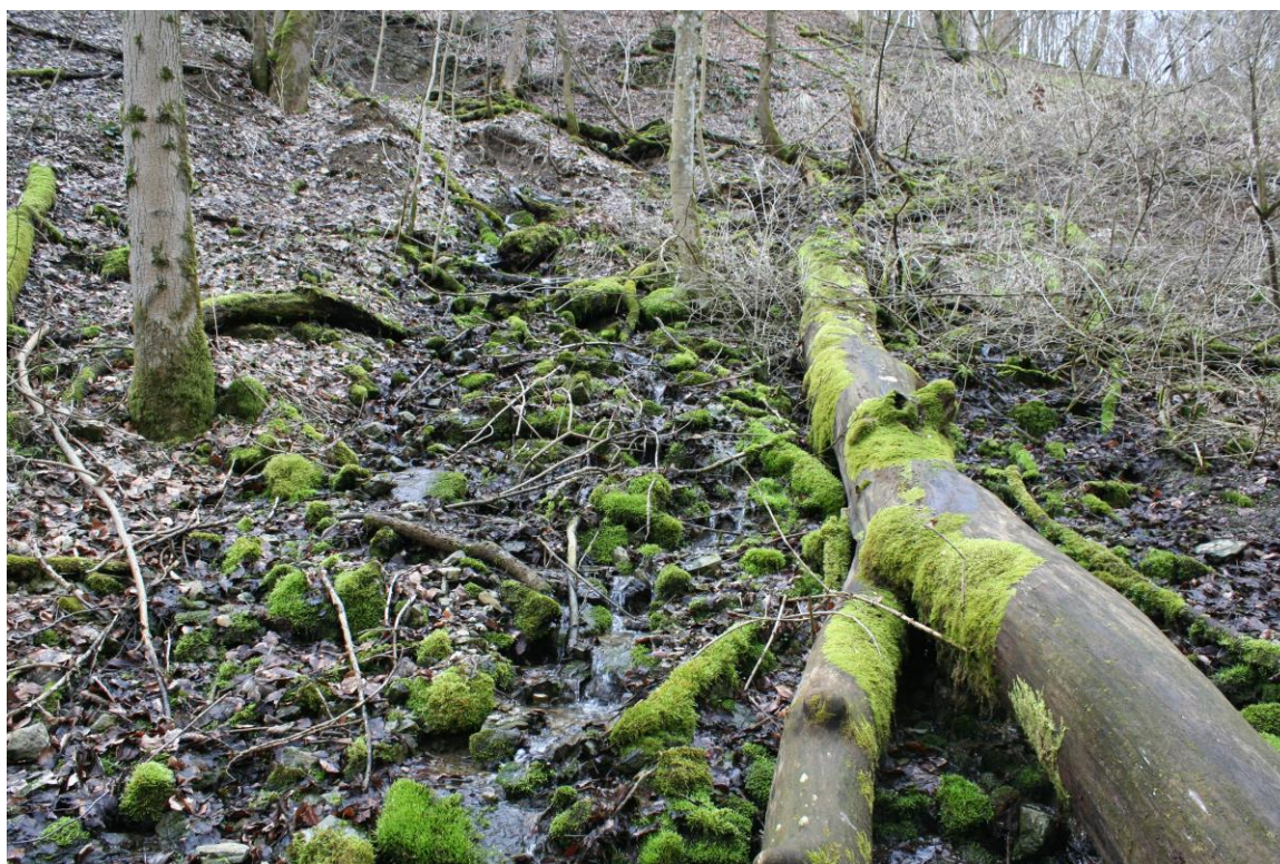
Abb.: Quellgebiet am Heiligenberg