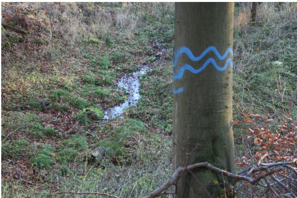
Abb.: Beispiel für die Kennzeichnung von Quellbereichen im Wald