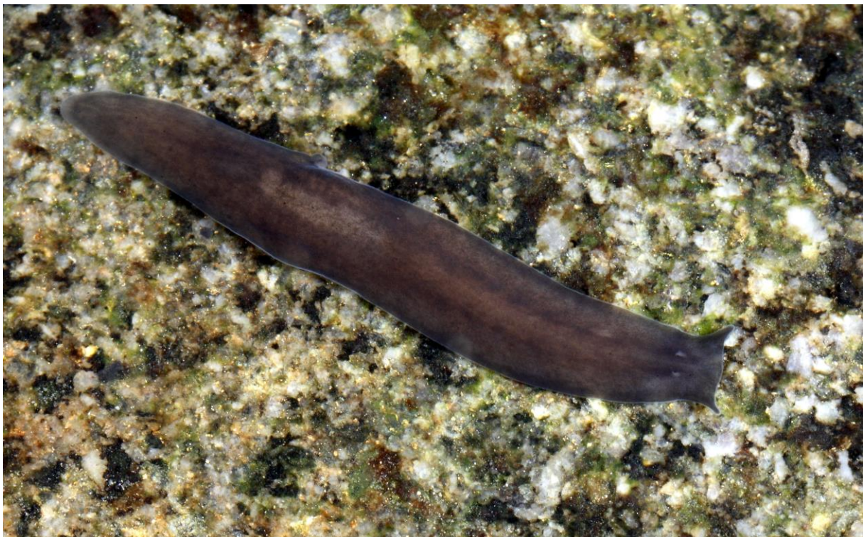
Abb.: Alpenstrudelwurm ( Crenobia alpina )

In nur 8 der untersuchten Quellen wurde der Alpenstrudelwurm ( Crenobia alpina ) gefunden. Die Art gilt als Glazialrelikt und ist im Saprobienindex für die Gewässergüte ein Anzeiger für absolut sauberes Wasser. Als krenobionte Art gilt die Köcherfliege Crunoecia irrorata , deren Larven in 41 der kartierten Quellen nachgewiesen wurden.