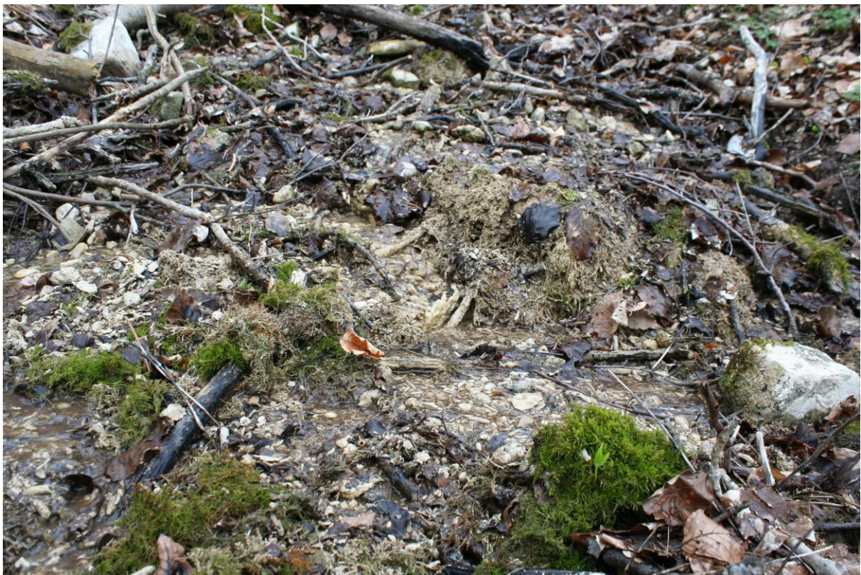
Abb.: Kalktuffbildung in der Heiligenbergquelle 42

Alle untersuchten Quellen liegen im FFH-Gebiet „Vorderrhön“ (DE5325305), im Vogelschutzgebiet „Hessische Rhön“ (DE5425401) und im Landschaftsschutzgebiet „Hessische Rhön“ (2631001).