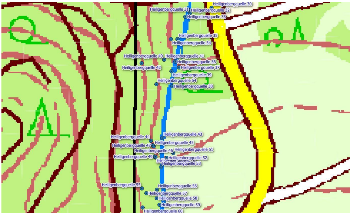
Abb.: Lage der untersuchten Quellen am Mittelberg - Detailkarte

Alle untersuchten Quellen liegen im FFH-Gebiet „Vorderrhön“ (DE5325305), im Vogelschutzgebiet „Hessische Rhön“ (DE5425401) und im Landschaftsschutzgebiet „Hessische Rhön“ (2631001).