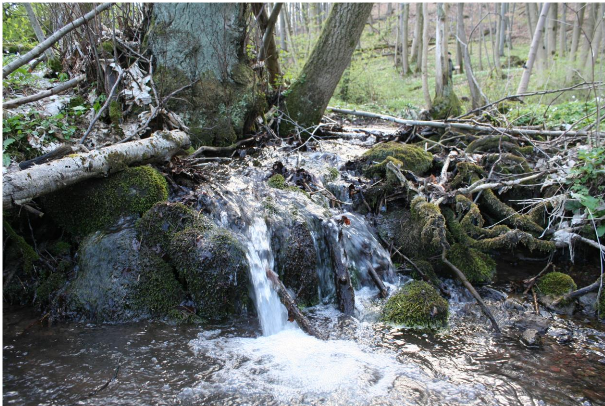
Abb.: Schlichtwasser - Naturnaher Quellbach am Osthang des Heiligenbergs