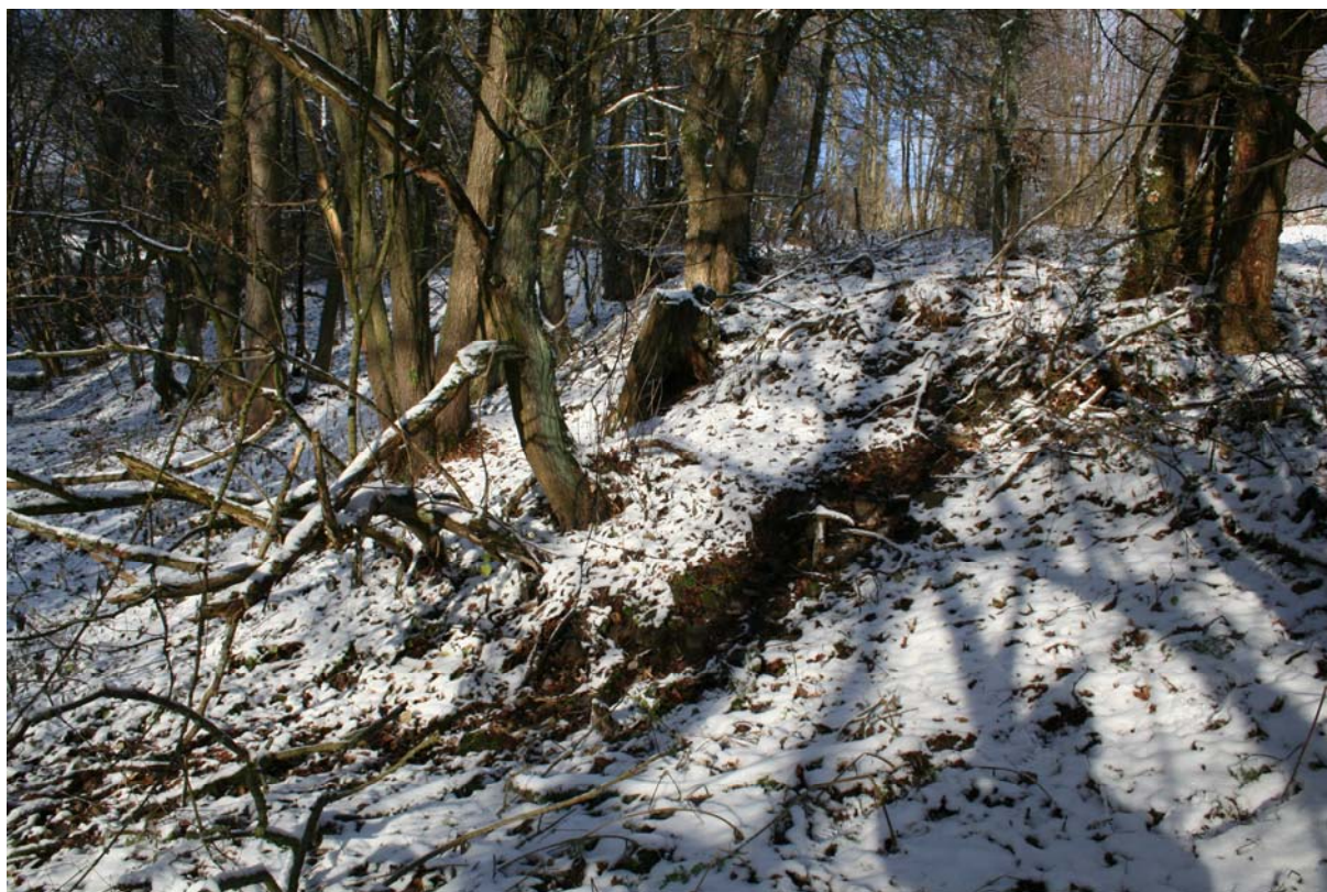
Abb.: Schmerbachquelle 03

Bezüglich der allgemeinen Ausführungen zur Bedeutung der Quellen, dem Quellschutz, wichtigen Standortfaktoren, den Untersuchungsmethoden, der Beweidungsproblematik sowie der Tier- und Pflanzenwelt der kleinräumigen Quelllebensräume wird auf die in den Jahren 2005 bis 2012 für das Biosphärenreservat Rhön erstellten Gutachten verwiesen (vgl. Tz. 5).