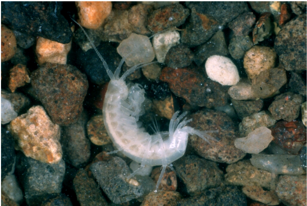
Abb.: Grundwasserflohkrebs ( Niphargus schellenbergi )

Das weitgehende Fehlen der für die Rhön charakteristischen Quellarten kann durchaus als Folge der landwirtschaftlichen Nutzung (Beweidung) angesehen werden.