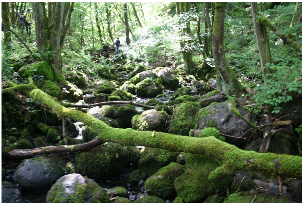
Abb.: Quellbach des Schmerbachs

Bezüglich der allgemeinen Ausführungen zur Bedeutung der Quellen, dem Quellschutz, wichtigen Standortfaktoren, den Untersuchungsmethoden, der Beweidungsproblematik sowie der Tier- und Pflanzenwelt der kleinräumigen Quelllebensräume wird auf die in den Jahren 2005 bis 2012 für das Biosphärenreservat Rhön erstellten Gutachten verwiesen (vgl. Tz. 5).