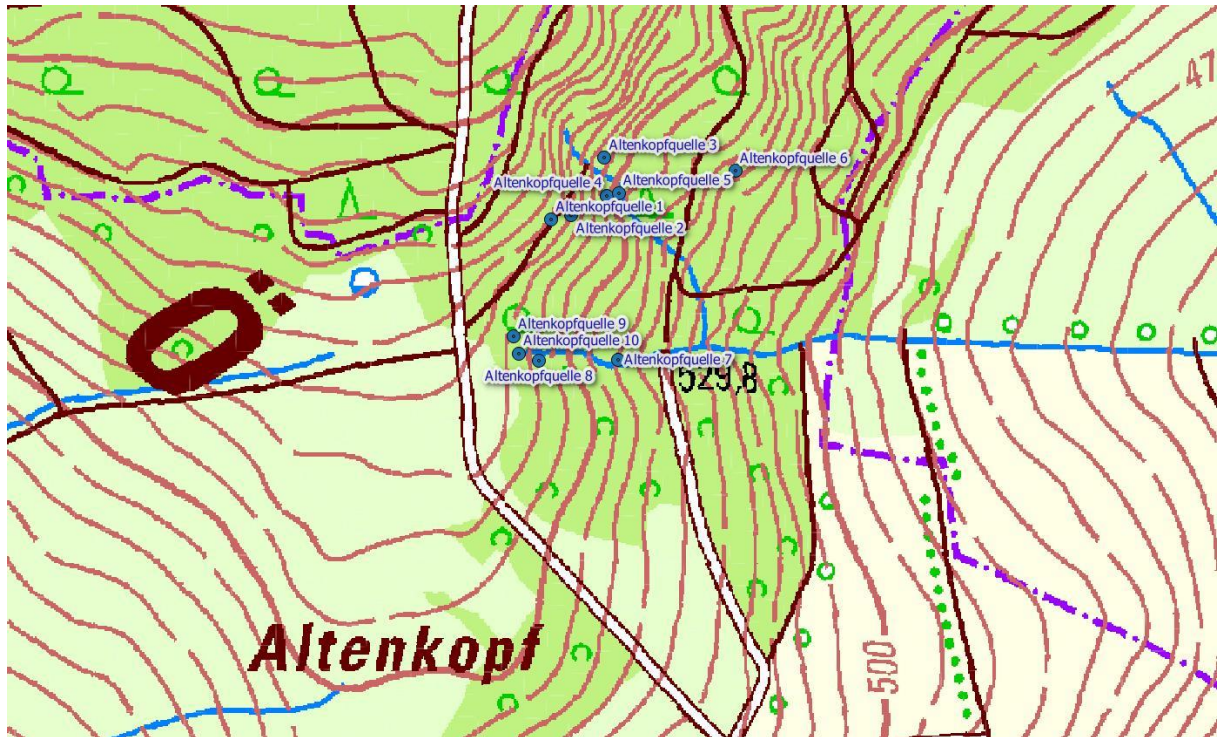
Abb.: Lage der untersuchten Quellen am Altenkopf

Die 10 untersuchten Quellen am Altenkopf liegen im Mittleren Keuper. Es handelt sich durchweg um ungestörte, naturnahe Waldquellen. Anthropogene Beeinträchtigungen der untersuchten Quellen konnten nicht festgestellt werden. Die Quellbereiche sollten im Rahmen der forstlichen Bewirtschaftung ausgespart werden.