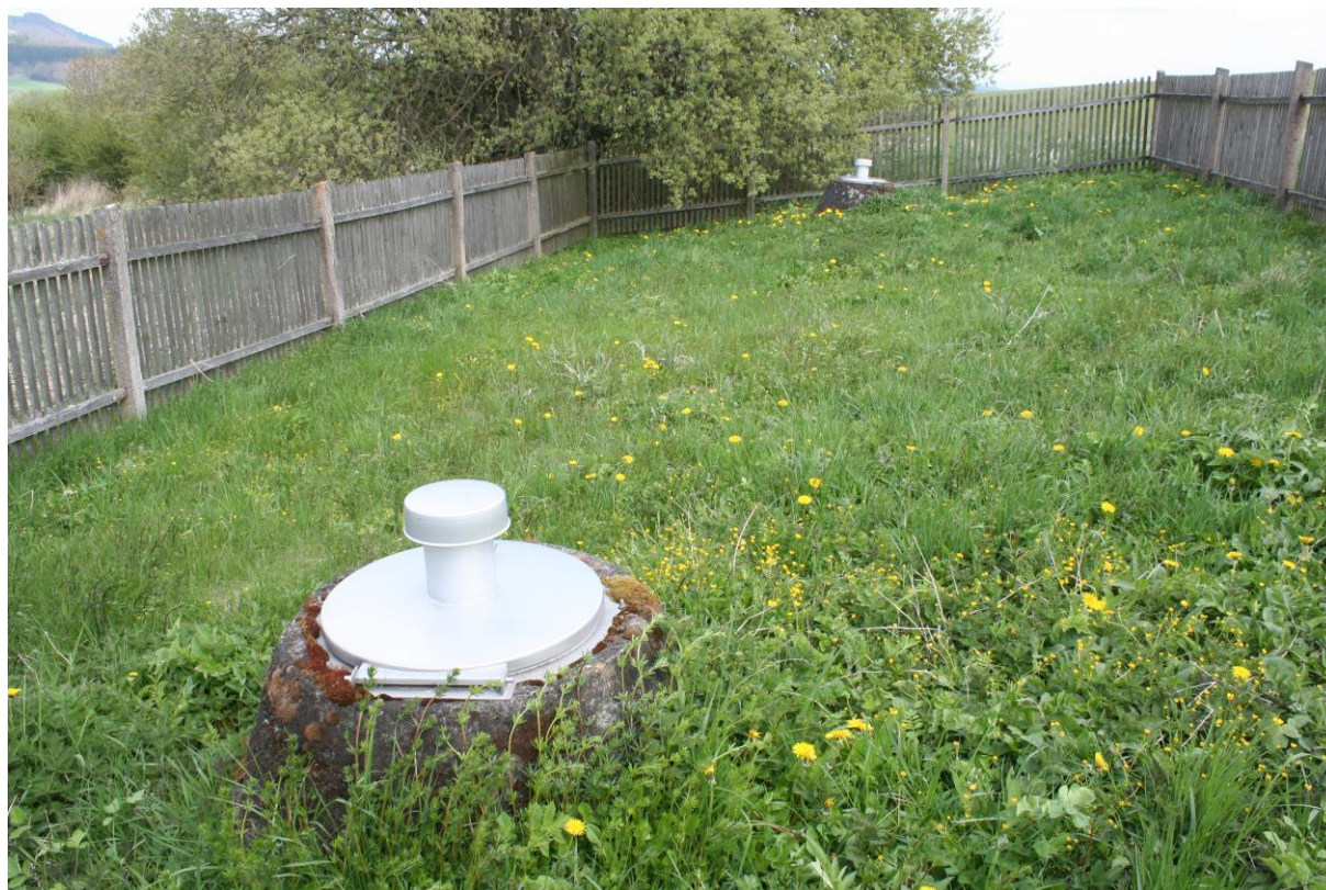
Abb.: Zur Trinkwassergewinnung genutzte Quellen südlich der Reifendorfer Mühle