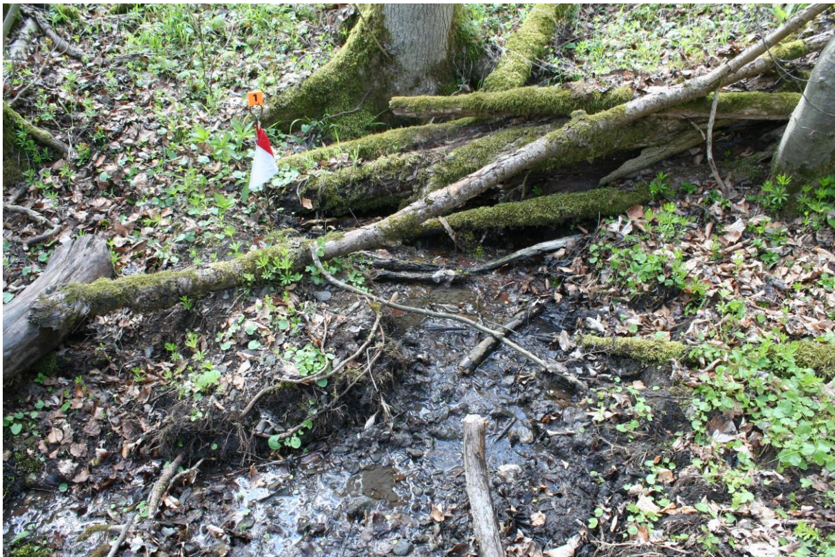
Abb.: Totholzstrukturen in der Altenkopfquelle 1

In 6 der untersuchten Quellen wurde der Alpenstrudelwurm ( Crenobia alpina ) gefunden. Die Art gilt als Glazialrelikt und ist im Saprobienindex für die Gewässergüte ein Anzeiger für absolut sauberes Wasser. Als krenobionte Art gilt die Köcherfliege Crunoecia irrorata , deren Larven in 16 der kartierten Quellen nachgewiesen wurden.